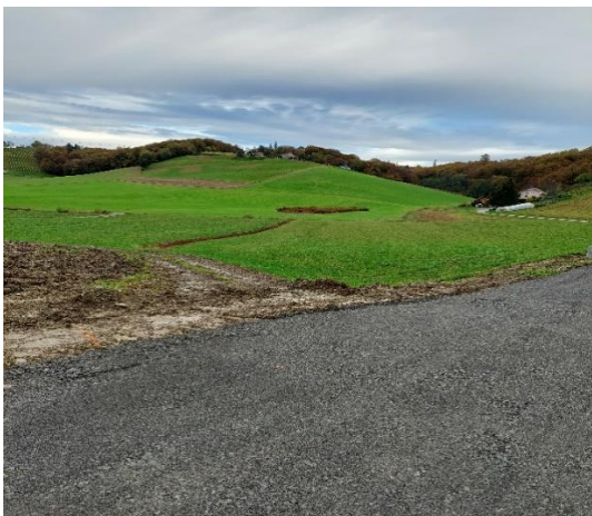
CESTA LETNIK TOMAŽIČ SP. VELKA – GRAMAZIRANJE IN PRIPRAVA

Za občino Šentilj smo izgradili in uredili spust za rafte v reko Muro v Sladkem vrhu.