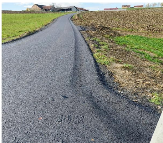
CESTA LETNIK TOMAŽIČ SP. VELKA - ZAKLJUČEK

Javno cesto smo uredili oz. asfaltirali z našim podizvajalcem iz Lenarta, Komunalo Slovenske Gorice d.o.o.