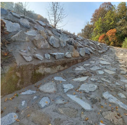
SPUST ZA RAFTE V REKO MURO V SLADKEM VRHU

Za občino Šentilj smo izgradili in uredili spust za rafte v reko Muro v Sladkem vrhu.