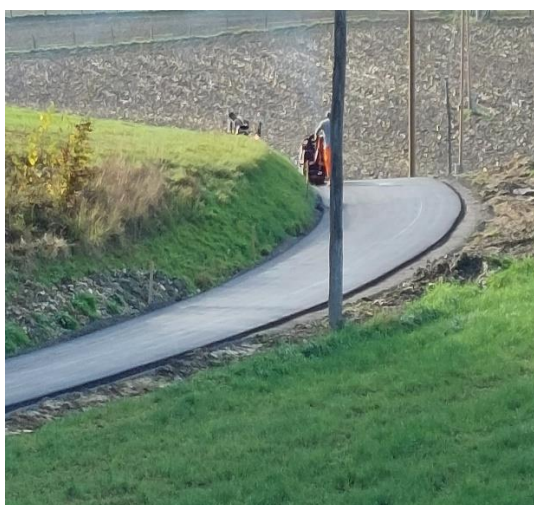
CESTA LETNIK TOMAŽIČ SP. VELKA - ZAKLJUČEK