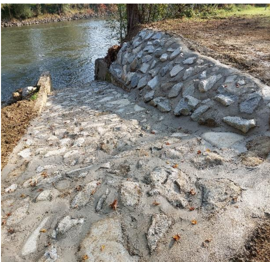
SPUST ZA RAFTE V REKO MURO V SLADKEM VRHU